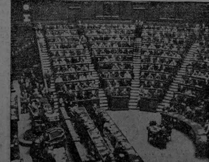
El gobierno representativo se restablece en Italia después de largos años en que el fascismo, que llevó el país al desastre, suprimió todos los elementos democráticos. En la foto se ve la Asamblea Consultiva, reunida en Roma, bajo la presidencia del conde Carlo Sforza.